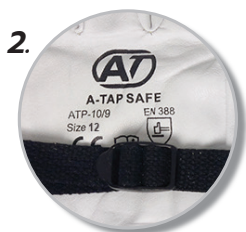
2. ขนาด 12 นิ้ว ใช้คู่กับ ถุงมือยาง Class 1-2 (size 9 นิ้ว)