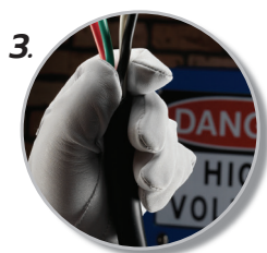
3. ใส่สบายให้ความคล่องแคล่วในการทำงานที่ละเอียดอ่อน